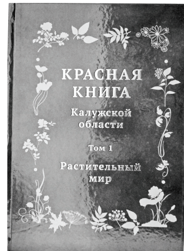
Красная книга нашего региона (1 том), изданная в 2015 году. Перечень «краснокнижных» видов изменился, значительно пополнились сведения о местах обитания редких видов, в том числе на территории Думиничского района.

В настоящее время наиболее интересными и ценными с точки зрения сохранения биологического разнообразия территориями в границах Думиничского района являются пойма реки Жиздра от дер. Дубровка до с. Чернышено, Брынское водохранилище и являющийся памятником природы регионального значения сосновый бор дер. Думиничи.