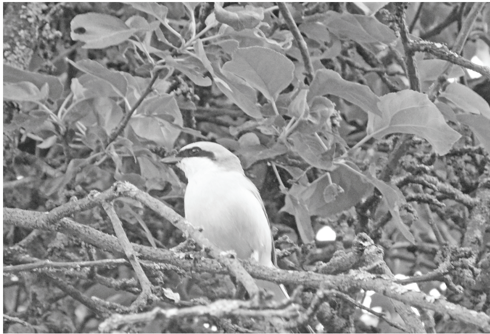
Обыкновенный сорокопут в хотисинском саду.