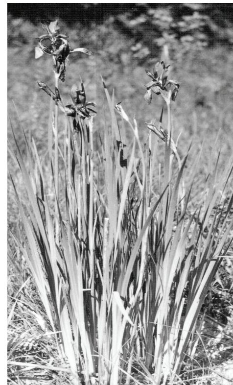
Ирис сибирский, р. Ресета, окрестности Клинца.