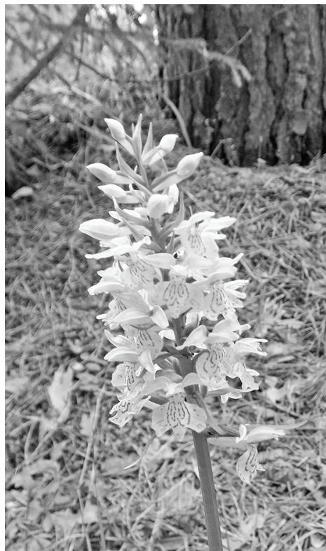
Ятрышник пятнистый (окрестности ст. Думиничи).