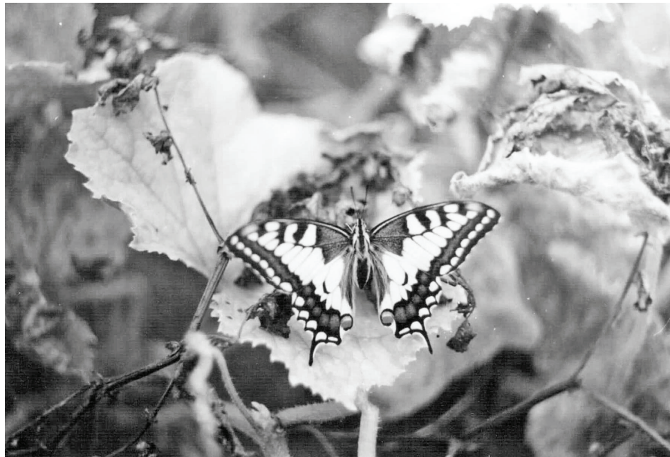
Махаон на огуречной грядке (д.Хотисино).

Из животных большинство видов, внесенных в Книгу, беспозвоночные (180). Млекопитающих — 18; птиц — 73; пресмыкающихся — 1; рыб — 8.