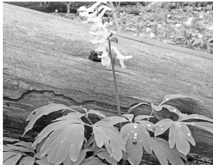
Хохлатка поля. Лес за д. Ломенка.

тусы редкости, уже нуждаются в охране новые виды. Решается вопрос с изданием более современной Красной книги. Ее первый том, посвященный растительному миру, вышел в 2015 году. В нем есть новые разделы, расширены как список видов, так и описательная часть. Нет никакой возможности подробно остановиться на всех важных сведениях (если кто-то серьезно интересуется — этот том уже имеется в районной библиотеке). Перечислю лишь виды, имеющие отношение к нашему району, которых не было в издании 2006 года.