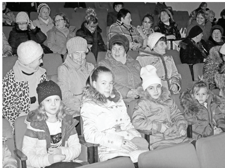
Подробности - на 2 стр.

Содержательные, интересные мероприятия прошли для всех слоев населения - от дошколят до пенсионеров. Центром торжеств стал районный Дом культуры. Там 10 ноября состоялась праздничная программа «Угра: рождение российского суверенитета».